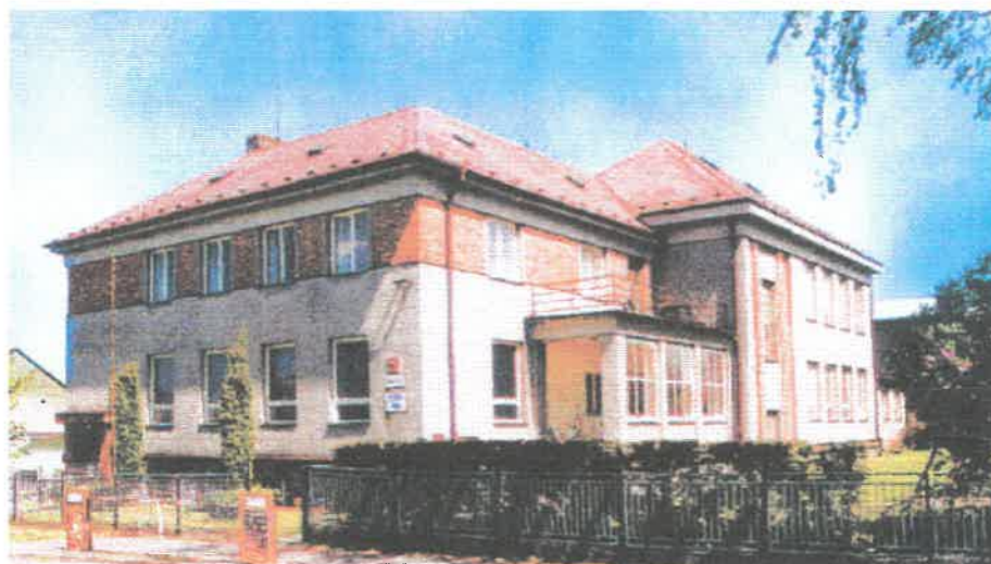
Základní škola v Jestřebí

V tomto roce byla provedena generální oprava místní komunikace na bytovkách v hodnotě zhruba 100.000 Kč,-, která byla několikrát rozkopaná a to od plynofikace obce a pokládání telefonních kabelů. Dále byla v kulturním domě opravena podlaha – parkety, menší zednické opravy a vymalování – vše v hodnotě 38.500,- Kč. Ve školní budově byla instalována nová zářivková svítidla ve třídách v ceně 16.000,- Kč. Dále obec nakoupila knihy do místní knihovny v hodnotě 6.000,- Kč, stolní počítač s tiskárnou a kopírkou pro OÚ v hodnotě 76.000,-Kč a pomůcky pro školu v hodnotě 25.000,- Kč. Z úvěru na plyn zbývá obci uhradit ještě zhruba 2.mil. Kč.