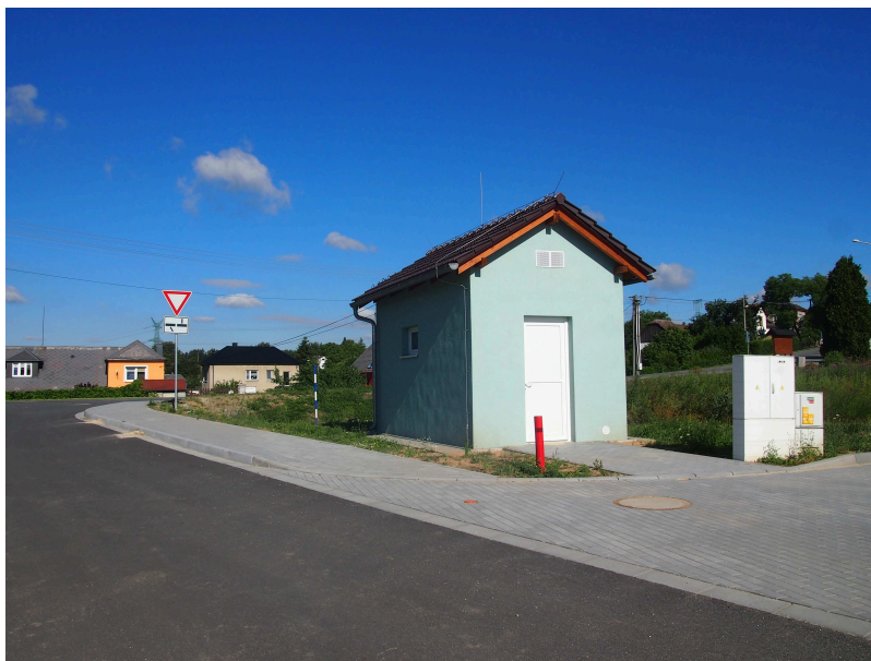
MÍSTNÍ KOMUNIKACE IV.TŘÍDY 3.1d