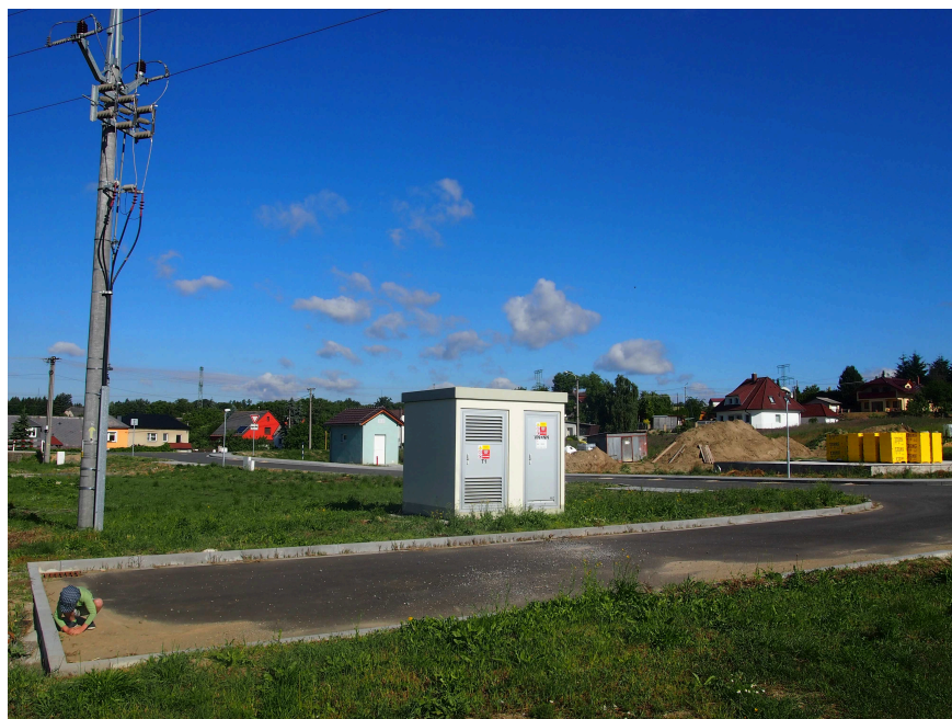
MÍSTNÍ KOMUNIKACE III.TRÍDY 8.1c