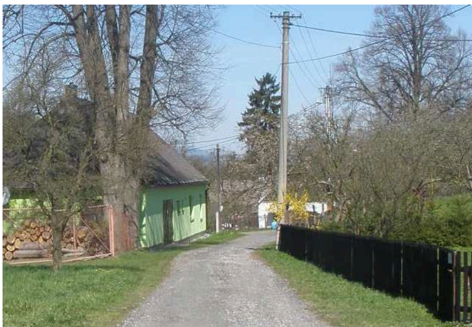
ÚČELOVÁ KOMUNIKACE 25.1u