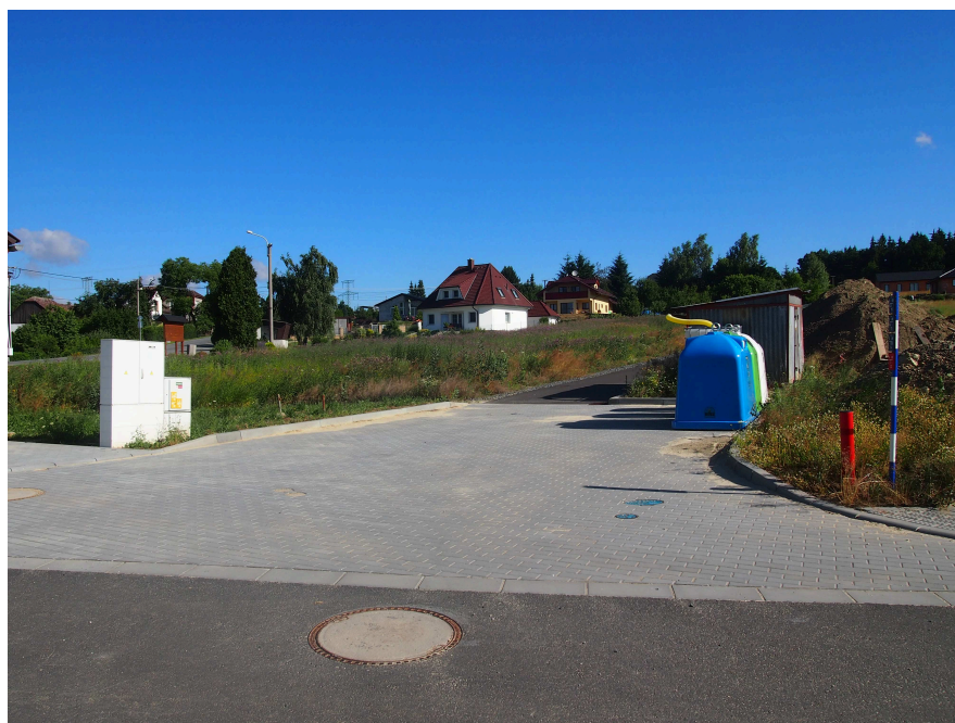
ÚČELOVÁ KOMUNIKACE 19.1u