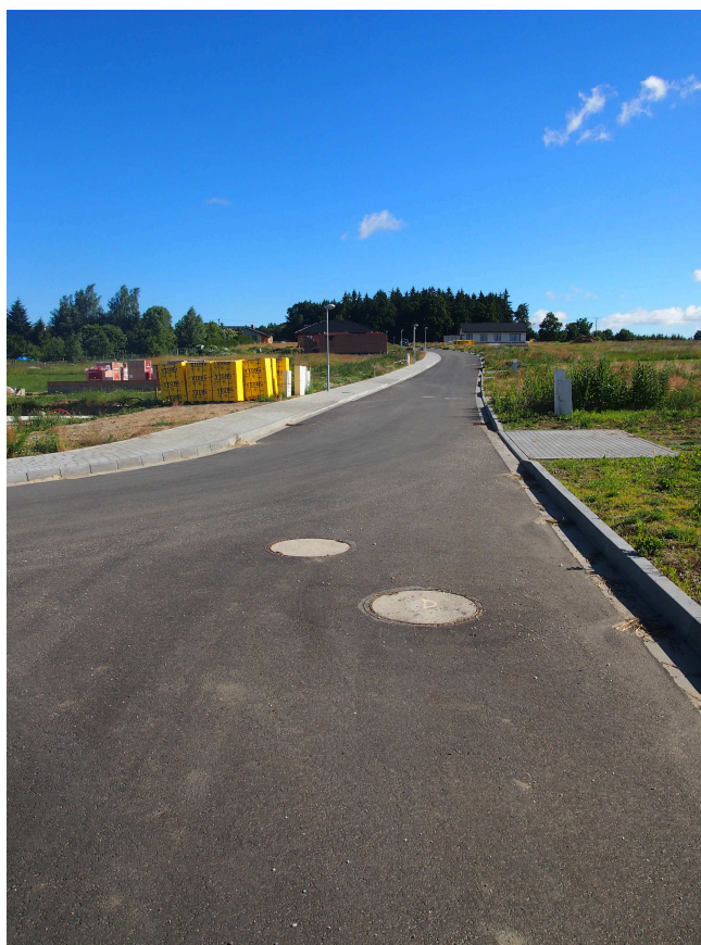
MÍSTNÍ KOMUNIKACE III.TRÍDY 8.1c